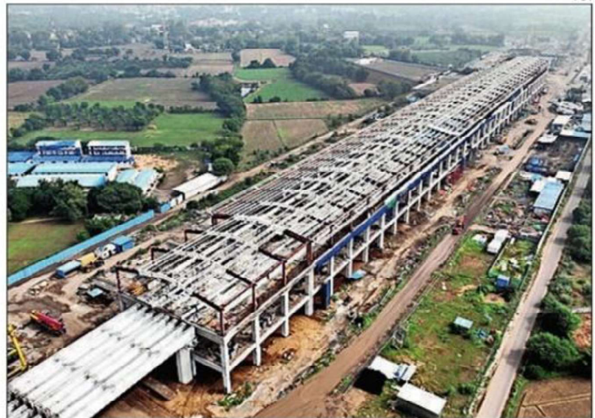
Civil works for stations have started along with works on Surat and Sabarmati high-speed rail depots

Laying of the first reinforced concrete track bed for the bullet train corridor, as used in Japan's Shinkansen rail network, has begun in Surat and Anand. This is the first time that the 'J-slab ballast-