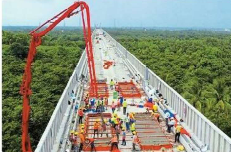
ट्रैक बिछाने का काम शुरू