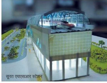
सूरत एचएसआर स्टेशन

मुंबई से अहमदाबाद तक देश की पहली हाई स्पीड (बुलेट ट्रेन) चलाई जानी है। नेशनल हाई स्पीड रेल कॉर्पोरेशन लिमिटेड (एनएचएसआरसीएल) ने पहले एक किमी वायाडक्ट का काम 6 महीने में पूरा किया था। इसके बाद अगले 50 किमी का काम पूरा करने में 10 महीने और इससे अगले 50 किमी यानी पूरे 100 किमी वायाडक्ट के कार्य में 6 महीने लगे। इस प्रोजेक्ट का काम करने के लिए कई ऐसी नई तकनीक का इस्तेमाल किया है, जिनका भारत में पहली बार प्रयोग हो रहा है। देश में पहली बार 40 मीटर लंबे फुल स्पैन (ब्रिज का सबसे छोटा हिस्सा) के बाँध बनाए जा रहे हैं। इन स्पैन को लॉन्च करने के लिए फुल स्पैन लॉन्चिंग तकनीक (एफएसएलएम) और स्पैन वाय स्पैन लॉन्चिंग सेगमेंट का उपयोग साथ-साथ किया जा रहा है। मेट्रो के लिए जो ब्रिज बनते हैं, उसमें जिस तकनीक से स्पैन लॉन्च होते हैं उससे 10 गुना तेजी से हाई स्पीड रेल के स्पैन लॉन्च होते हैं। सूरत एचएसआर स्टेशन पर भी कॉन्कोर्स और रेल लेवल स्लैब पूरा कर लिया गया है। स्टेशन पर पहला स्लैब 22 अगस्त 2022 और आखिरी स्लैब 21 अगस्त 2023 को ढाला गया। सूरत बुलेट ट्रेन स्टेशन का कॉन्कोर्स एरिया 450 मीटर लंबा है। स्टेशन का एरियाल व्यू हीरे जैसा दिखेगा। स्टेशन स्ट्रक्चर तीन लेवर्स में होगा। यहां यात्रियों को मेट्रो एयर कंडीशनिंग, बिजनेस क्लास लाउंज, नर्सरी, लिफ्ट, एस्केलेटर आदि सुविधाएं मिलेंगी।