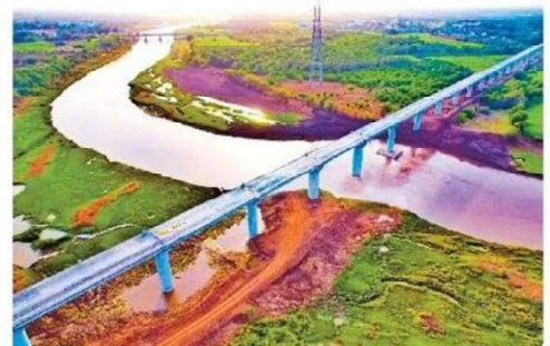
नवसारी पुर्णा नदी पर पुल