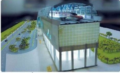
सूरत एचएसआर स्टेशन