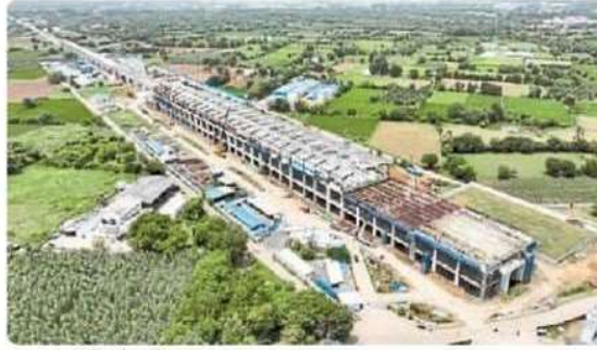
आणंद में निर्माणाधीन एचएसआर स्टेशन।

मीटर लंबा कॉन्कोर्स लेवल स्लैब पूरा हो चुका है।