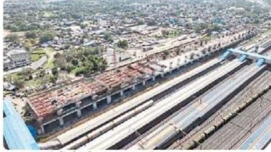
अहमदाबाद में निर्माणाधीन एचएसआर स्टेशन।

स्टेशन को लगभग 38 हजार वर्ग मीटर क्षेत्र में मौजूदा अहमदाबाद स्टेशन की प्लेटफार्म संख्या 10, 11 एवं 12 के ऊपर निर्मित करने की योजना है। स्टेशन की कुल ऊंचाई जमीनी स्तर से 33.73 मीटर है। स्टेशन का 435